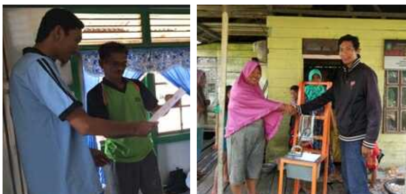
Gambar 6. Penyerahan SOP mesin pemotong keripik keladi dan mesin pengupas kulit nenas

Kegiatan terakhir adalah penyerahan SOP mesin pemotong keripik keladi dan mesin pengupas kulit nenas. Tersedianya SOP (Standar Operasional Pelaksanaan) untuk memudahkan mitra dalam mengelola dan memelihara mesin pemotong keripik keladi dan mesin pengupas kulit nenas.