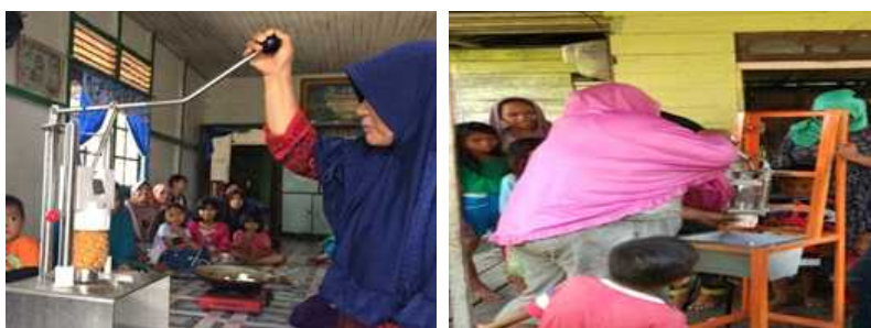
Gambar 4. Simulasi Penggunaan Mesin Pemotong Keripik Keladi dan Mesin Pengupas Kulit Nenas