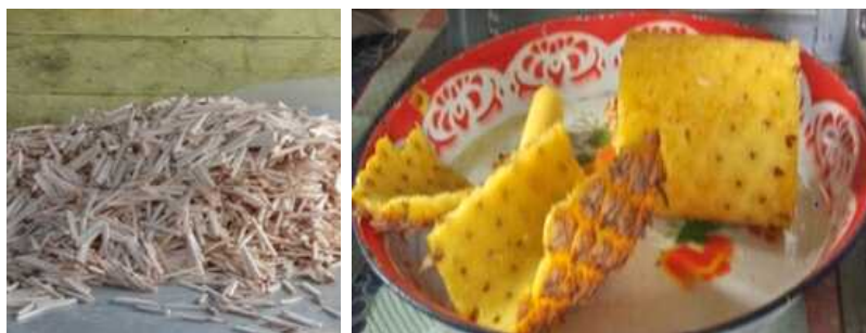
Gambar 7. Hasil Pemotongan Talas (Keladi) dengan Menggunakan Mesin Pemotong Keripik Keladi dan Hasil Pengupasan Kulit Nenas dengan Menggunakan Mesin Pengupas Kulit Nenas

mitra untuk meningkatkan taraf hidup dan kesejahteraan masyarakat. Sedangkan mesin pengupas kulit nenas bertujuan untuk mempermudah pengupasan kulit nenas dalam jumlah besar. Salah satu produk yang dapat diolah dari nenas adalah selai nenas. Sehingga dengan adanya alat ini dan kegiatan pelatihan pembuatan selai nenas kelompok tani dapat membuka peluang usaha dan meningkatkan kesejahteraan masyarakat.