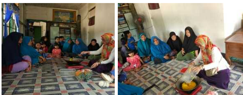
Gambar 5. Pelatihan Pembuatan Selai Nenas

Kegiatan terakhir adalah penyerahan SOP mesin pemotong keripik keladi dan mesin pengupas kulit nenas. Tersedianya SOP (Standar Operasional Pelaksanaan) untuk memudahkan mitra dalam mengelola dan memelihara mesin pemotong keripik keladi dan mesin pengupas kulit nenas.