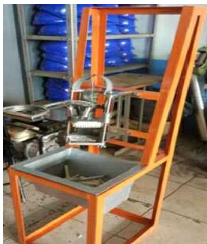
Gambar 2. Desain Mesin Pemotong Keripik Keladi