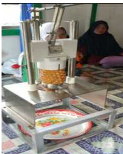
Gambar 3. Desain Mesin Pengupas Kulit Nenas